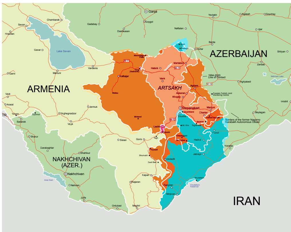
A háború vége