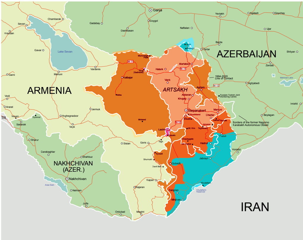
A háború közepe

A Hadrutért folyó harcok befejeződésével párhuzamosan az azeri katonai vezetés az offenzíva súlypontját áthelyezte a megszállt területek déli részére. Október 16-tól kezdve azeri gépesített és páncélos erők gyors ütemben nyomultak előre nyugati-déli nyugati irányban, az iráni határt jelentő Aras folyó mentén. Az örmények csak lassítani tudták az előrenyomulást, de megállítani nem, részben a dróncsapások, és a súlyosbodó logisztikai nehézségek miatt, részben pedig azért, mert ennyire mélyen a megszállt területen belül már nem voltak olyan erősen kiépített védőállásaik, mint keletebbre. Az azeri erők október 22-re elérték Agband falut az örmény–azeri–iráni hármashatáron, ezzel pedig helyreállították az ellenőrzést az azeri–iráni határ teljes szakaszán.