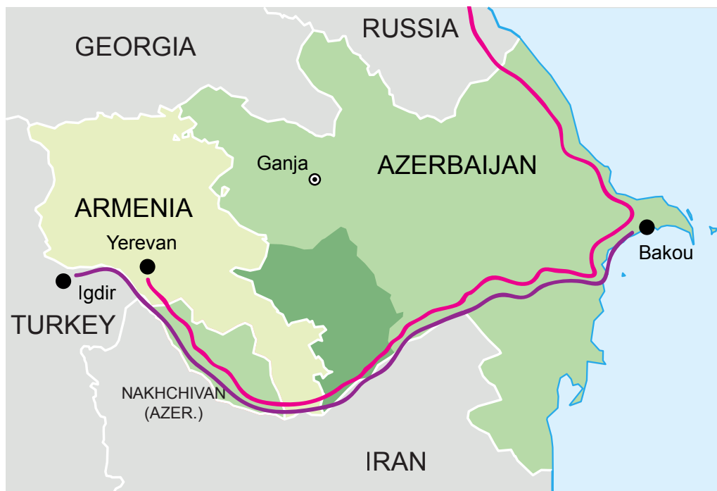
Az Örményország déli részén átvezető szállítási folyósók terve 96

Az egyezmény előírja továbbá, hogy Örményország déli részén szárazföldi korridort kell létesíteni a nahicseváni exklávé és a frissen felszabadított nyugat-azerbajdzsáni területek között. Ezt a szállítási folyósót Örményország területén belül az orosz Szövetségi Biztonsági Szolgálat (FSzB) határhoi ellenőrzik majd. A nahicseváni korridorról a november 9-i egyezmény még semmi többet nem rögzített; a részleteket végül egy január 11-i megállapodásban szabályozták a felek. 95 Ennek értelmében Örményország déli részén az orosz vasúttársaság szakemberei megkezdik az ott a szovjet időkben működő, ám az első hegyi-karabahi háború idején felszedett vasútvonal helyreállítását, és napirenden van a közúti kapcsolatok helyreállítása is.